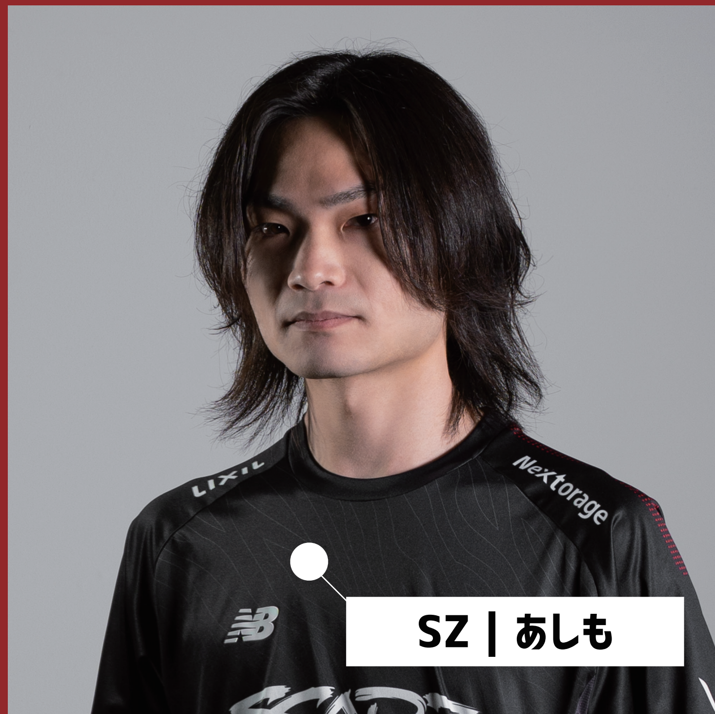
SZ | あしも

スマブラの大会で勝ち、名声を得ればスポンサーが付くことがあります。『ZETA Division』や『SCARZ』などと言った大手のゲーミングチームもスマブラ部門を設立しており、選ばれたプレイヤーは、自分のスマブラ活動へ、金銭的支援を受けることができます。